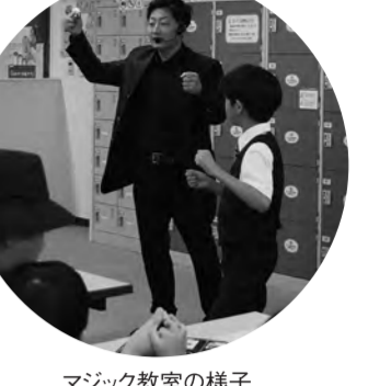
マジック教室の様子

三条公民館「尾西生涯学習センター」で11月10日、「三秋のフェスタ'24」が開催された。当日は、子どもから大人までの幅広い世代、約700人が来場し、賑わいました。 会場では、ストラクチャーやトヤワなげなどのスタンプラリーゲームや、おりがみ、パルーン、ドローン、マジック教室などバラエティ豊かな催しを実施され、中でも注目を集めたのが、初開催の「ピアノのある作品展」。小学生から大人まで、自慢の演奏を披露する「ストリートピアノ」が行われ、アニメーションからK・POPまで幅広いジャンルの音楽が会場を彩りました。さらに、ピアノの周りに地元元アマチュア作家による絵画なども展示され、訪れた人は音楽と美術のハーモニーを楽しみました。 また、6階の大ホールではフラダンスや「新しいふき太鼓」にマジックショー、三小音楽教師による「クロネコトリオ」などの地元団体やアーティストが多彩なステージを披露。トリを務めた「みちかむじか」のステージでは、三条小のタンパリンなどを演奏。「クノネコトリオ」も加わり、盛り上がりは最高潮に達しました。