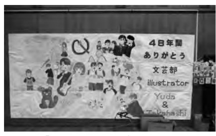
校内には「48周年ありがとう」のエルボードも