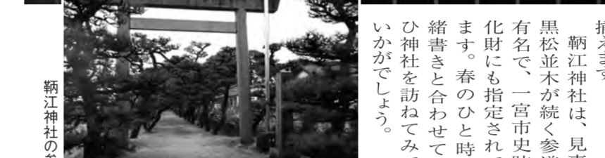
「中ほどの跡が新江神社西遺跡」